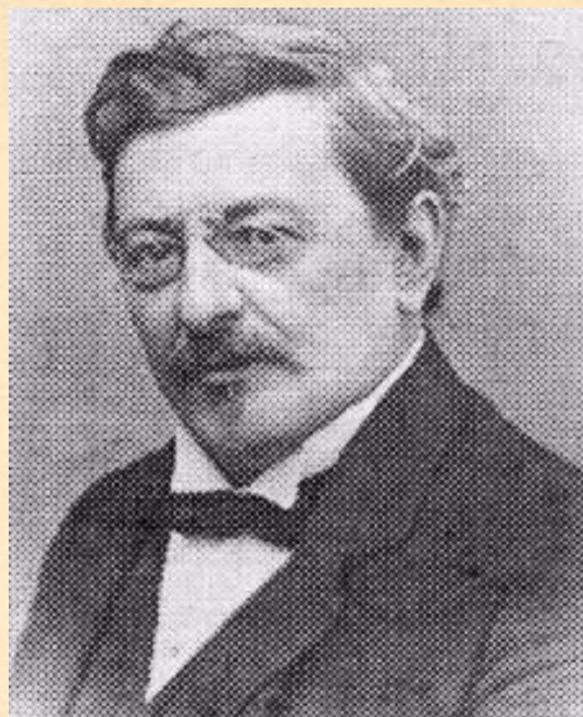
Figura 1: Retrato fotográfico de Eduardo L. Holmberg.

Entre 1872 y 1886 Holmberg realizó una serie de excursiones relacionadas con las ciencias naturales destacándose « Viaje a la Patagonia »,