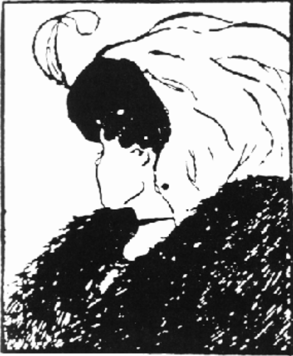
Figura 2: Dibujo Gestalt. ¿Qué ve, una joven mujer o una vieja bruja?

Un ejemplo de la subjetividad de las observaciones son los dibujos Gestalt que se pueden percibir de diferentes maneras (Figura 2). Una imagen normalmente se revela de inmediato y otra que se encuentra dentro del dibujo exige una búsqueda para ser encontrada (Perls et al., 1951). En la Figura 2, algunos observadores ven primero a la vieja bruja y otros ven a la joven mujer. Al observar un fenómeno natural, ¿cómo saben los científicos si la imagen que perciben es la correcta?