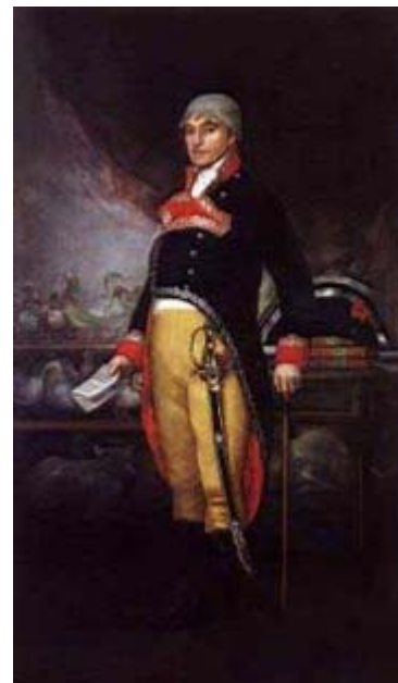
Retrato de Félix de Azara, por Francisco Goya (1805). Oleo sobre Tela, 210x124cm.

Felix de Azara, nació en Barbuñales, España el 18 de mayo de 1742, aunque otros autores indican 1746, dentro de un seno familiar de