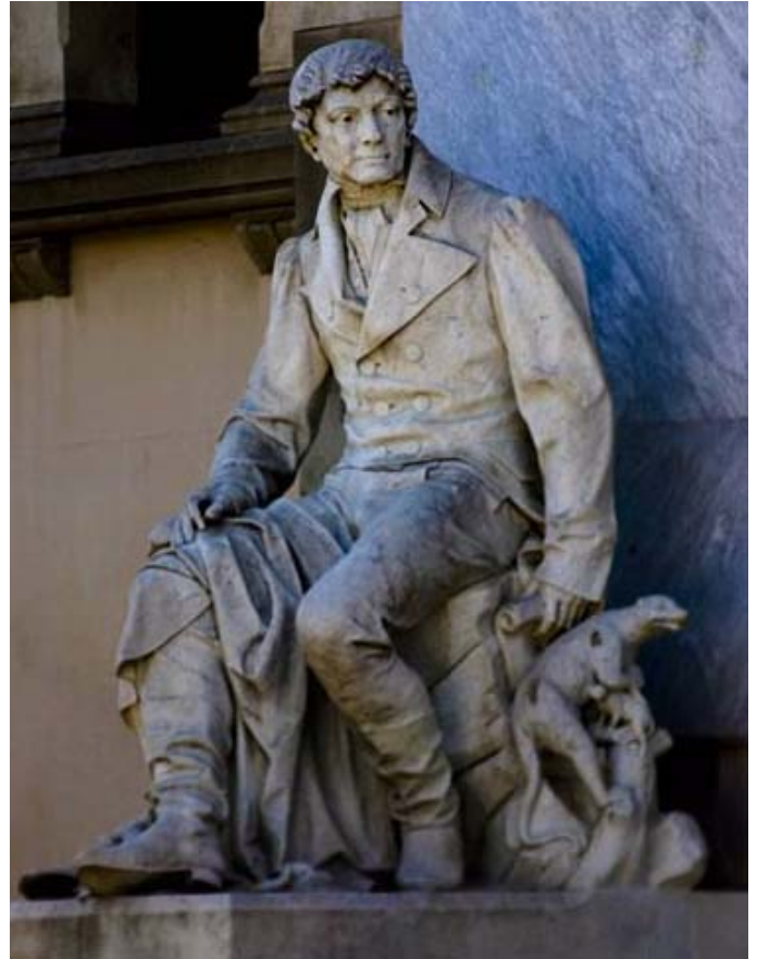
Estatua de Felix de Azara en el Museu Martorell (Barcelona, España).

Comenzó por ello a hacer observaciones de los animales por sus propios medios, pero luego consiguió interesar a España para que avale en parte sus investigaciones. Su curiosidad innata sumada a los conocimientos de matemática le permitieron realizar innumerables observaciones de los lugares recorridos y