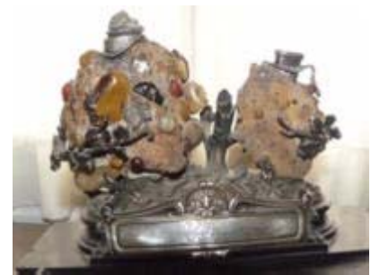
Figura 5: Tintero con incrustaciones de restos fósiles (entre ellos un ojo de pez) y piedras hecho artesanalmente por el propio Francisco Javier Muñiz en 1833.