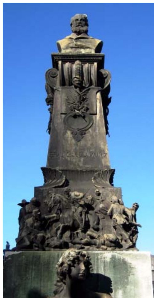
Figura 3: Detalles de diferentes partes del mausoleo de Francisco Javier Muñiz ubicado en el Cementerio de La Recoleta, Buenos Aires, Argentina.

La monografía documenta la hechura de utensilios con partes de ñandú (huesos, piel, esternón, esófago etc.), el distinto sabor de la carne o la