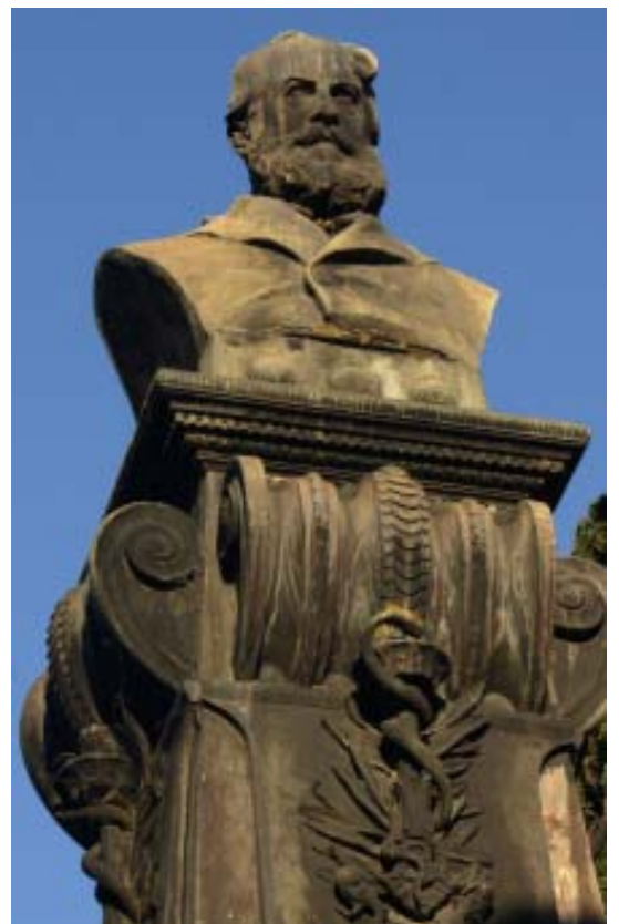
Figura 1. Rostro de Francisco Javier Muñiz, parte de su mausoleo ubicado en el Cementerio de La Recoleta.